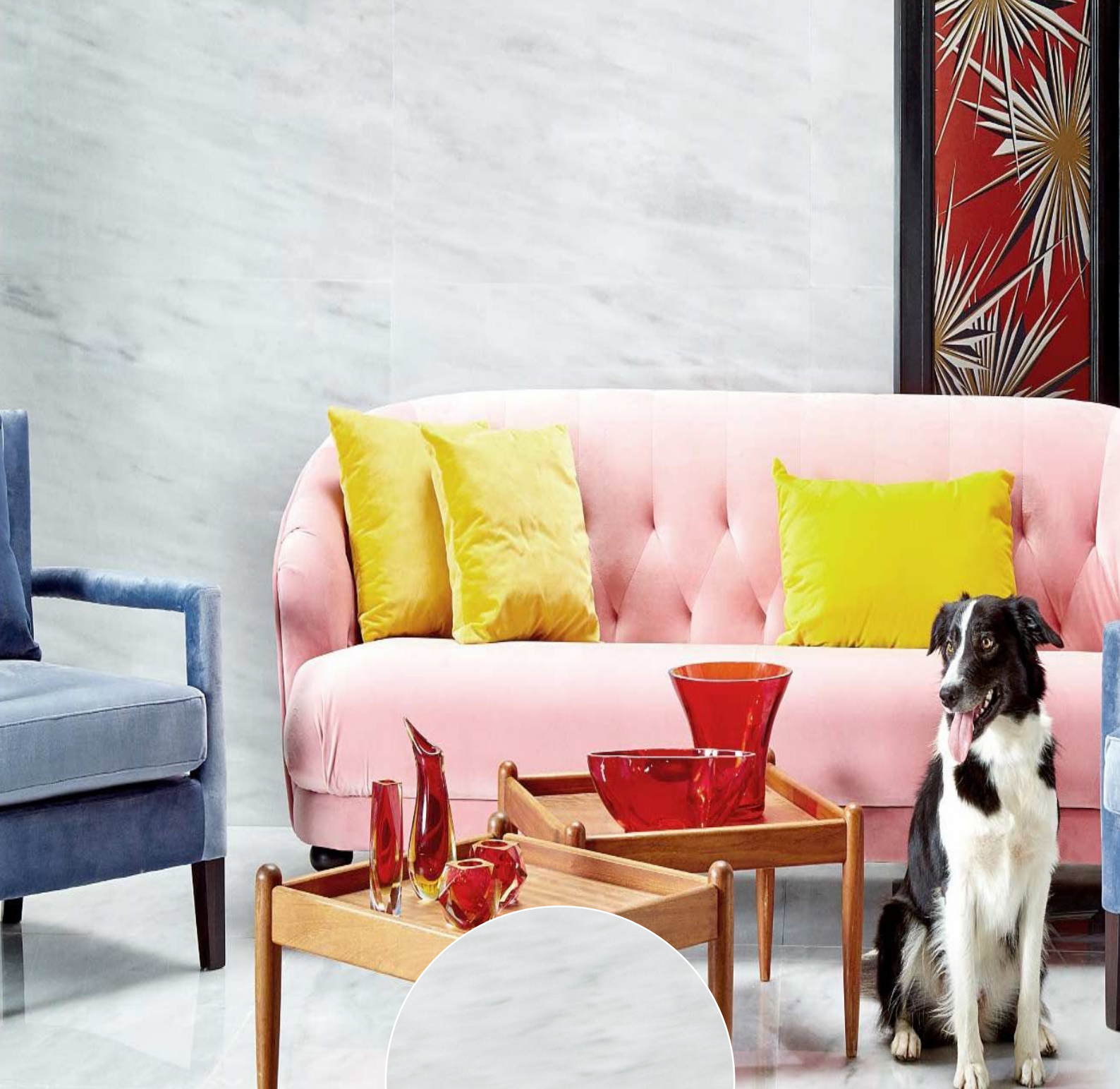
МРАМОР WHITE GIULIA